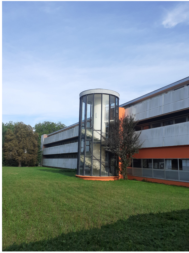
Cage d'escalier hélicoïdal, Lycée Henri Nominé, arch. Georges-Henri Pingusson, 1968-1973.