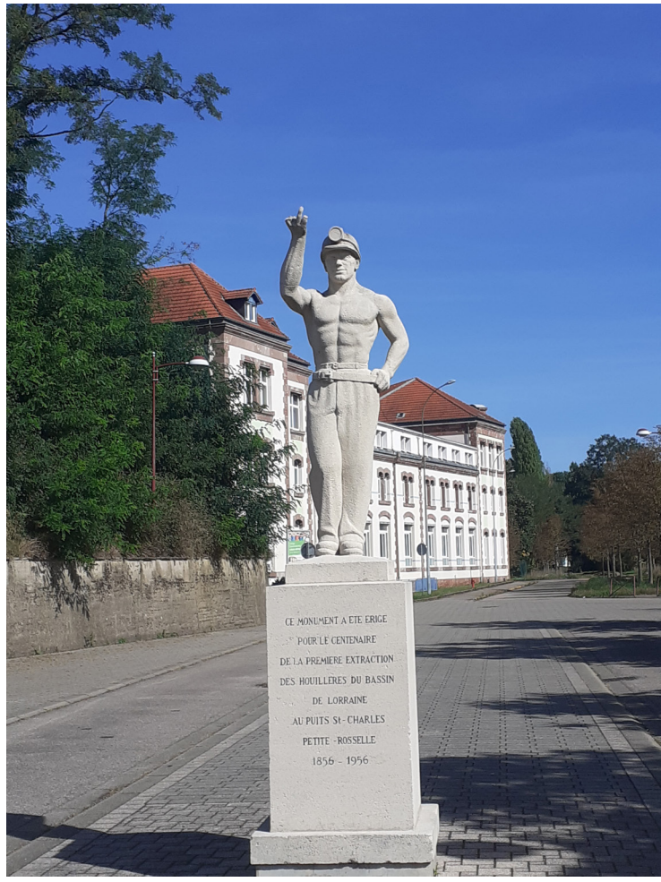
Statue du mineur par le sculpteur Janthial, Petite-Rosselle, 1956