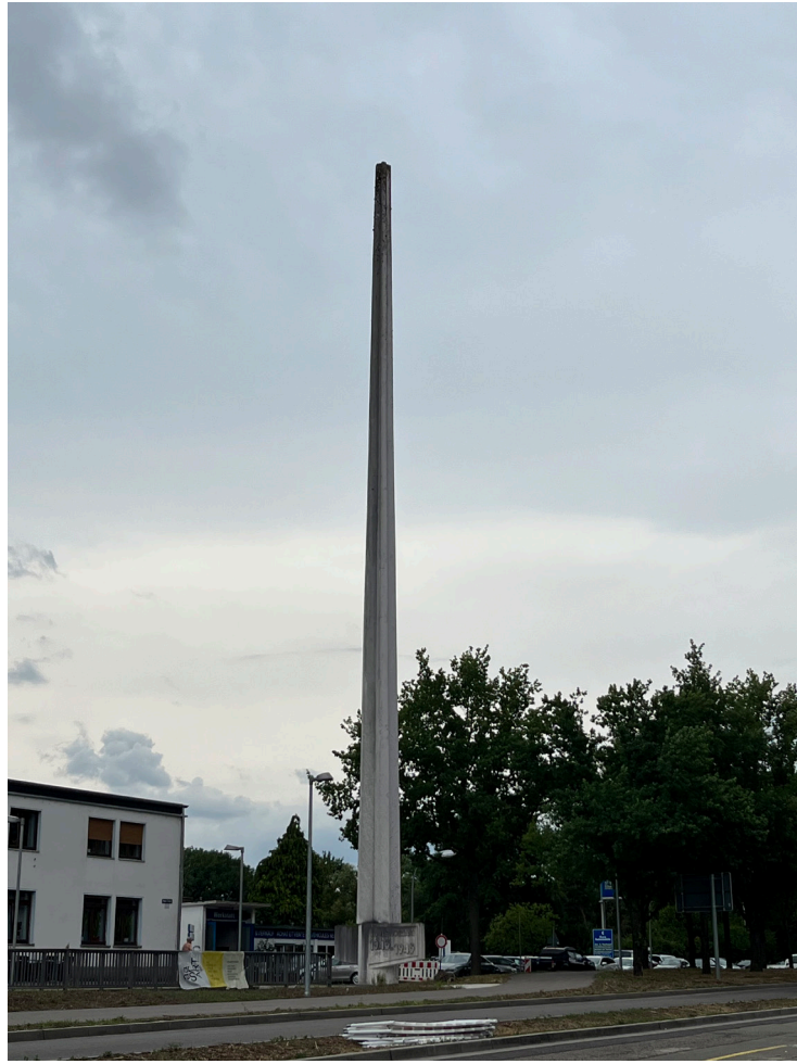
Monument commémoratif de Neue Bremm, camp de la Gestapo de Sarrebruck, 1947.